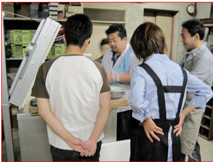
□還元焼成した作品の窯だしを見学する皆さん